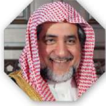
رئيساً معالي الشيخ

صالح بن عبد العزيز آل الشيخ - حفظه الله -