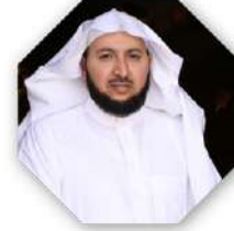
الشيخ نائب الرئيس