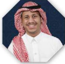
مسؤولاً مالياً الاستاذ

صالح بن عبد العزيز آل الشيخ - حفظه الله -